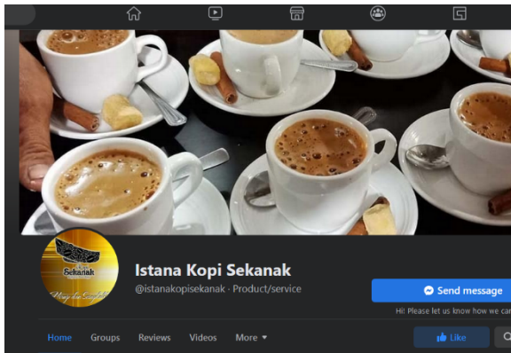
Gambar 1. Facebook kopi Sekanak

Selain itu Kopi Sekanak aktif memanfaatkan sosial media sebagai media promosi. Berikut platform Instagram, Facebook You Tube dan Twitter yang digunakan Kopi Sekanak.