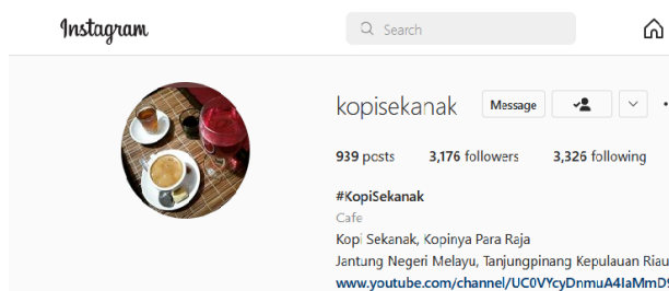
Gambar 2. Instagram Kopi Sekanak

Dari akun Instagram Kopi Sekanak dapat dilihat berbagai capture produk kopi yang dijual. Suasana yang dibangun dari media sosial Kopi Sekanak pada umumnya mengusung narasi historis dan budaya Melayu secara teatral dengan tampilan foto-foto pelanggan yang berkunjung