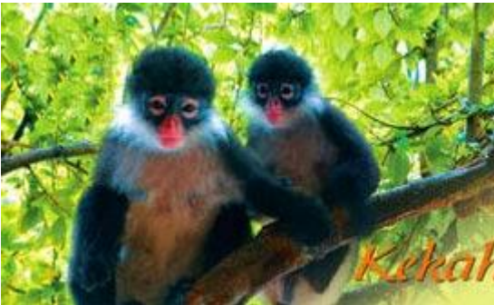
Gambar 4 Potensi Wisata Alam Satwa Khas Natuna