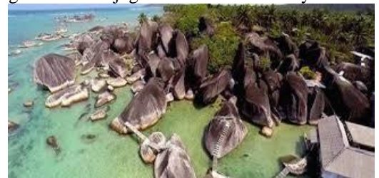
Gambar 6 : Alif Stone Park