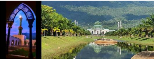
Gambar 3 Potensi Wisata Masjid Agung Natuna (Foto Pengamatan pribadi September 2022 )