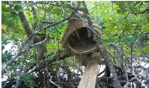
Gambar 7 : Wisata Semitan