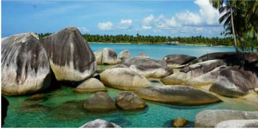
Gambar 1 Potensi Wisata Pantai Batu Kasah Natuna (foto Dinas Pariwisata Natuna)