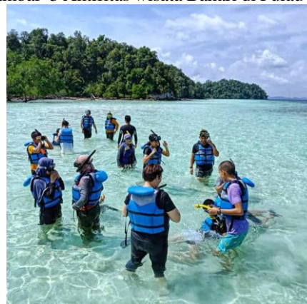
Gambar 3 Aktifitas wisata Bahari di Pulau Abang

Selain itu Pulau Abang memiliki keindahan laut yang menarik seperti air lautnya yang biru dan jernih, memiliki relief pantai berbatu yang unik, kondisi terumbu karang yang baik, serta memiliki jenis ikan karang yang beragam dengan tingkat kedalaman yang mendukung, sehingga kawasan perairan ini lebih cocok untuk wisata snorkeling , dibandingkan dengan wisata diving , mangrove ataupun wisata lamun. Hal ini disebabkan oleh tingkat kedalaman perairan yang rendah sehingga tidak memungkinkan untuk melakukan aktivitas wisata diving , kemudian rendahnya persentase tutupan dan jumlah jenis mangrove yang sedikit serta memiliki tutupan lamun yang jarang sampai dengan sedang menunjukkan kawasan ini kurang cocok untuk wisata mangrove ataupun lamunain-lain. (Khairunnisak Agustina, Winda Sofro Sidiq, 2021)